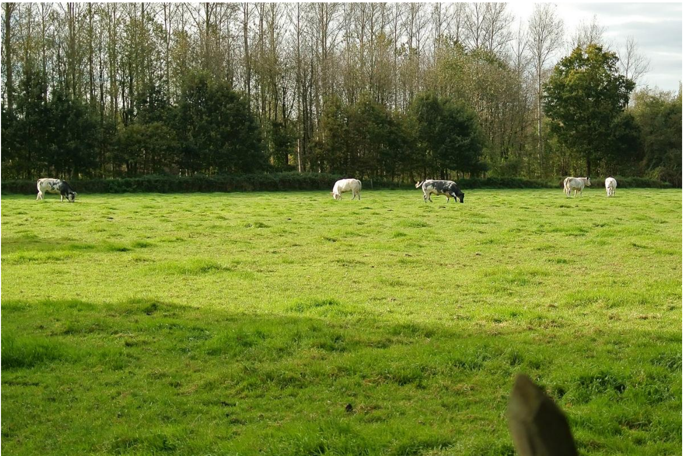
Het BWB of Belgisch wit blauw